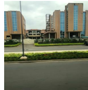
Batiman modèn nan katye coutounou

gouvènman ak diplomasi Cotonou yo ye. Modènite ak jan katye yo pwòp te vin kenbe atansyon m.