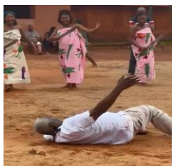
Siméus pran lwa

Kriz san zatann sa ki te pran kolèg mwen an, eske se pa tankou yon fòm katazis? Paske li di: “Mwen ap viv ak vodou, se gidò ak baz lavi m. Lè mwen rive Benen, mwen te konekte ak sous la menm moman e mwen tou konnen se la pifò fanmi Ayiti nou yo soti. Nan Benen, mwen lakay mwen”.