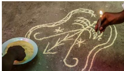
Vèvè : pou rele lwa yo

Kisa vodou ye pou Ayisyen? Vodou, ki vle di "lespri" oswa "divinite" nan lang Fon wayòm Afriken Dahomey a (kounye a Benen), te parèt kou yon relijyon afro-ayisyen nan 16yèm pou rive nan 19yèm. Filozofi vodou a melanje ak brase kwayans espiritiyèl afrik lwès ak katolik women, yon konvèjans ke yo rekonèt kòm senkretis relijye. Prensipal disip li yo se Ayiti, nan karayib la ak New Orleans yo ye. Vizyon vodou genyen pou monn nan gen a wè ak filozofi, laswenya, jistis ak relijyon, tout bagay ki anrasinen nan prensip fondamantal ke tout bagay gen yon sans espiritiyèl.