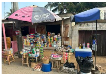
Boutik nan Cotonou

vann anpil afriken tankou esklav pou vin travay nan koloni Sendomen. Alèkile se yon gwo disnati wayal ki genyen anpil pouvwa k ap reye sou wayòm Dahomey a, se te wa Houégbadja ki te kreye dinasti sa nan 16 yèm syèk. Nan monachi absoli sa, se wa premye lidè espiyèl la, ki genyen tout richès wayòm nan e ki gen dwa lavi ak lanmò sou sijè li yo.