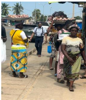
On ti flannen nan Benen

Mwen te vin deside ale mache nan Benen nan pami abitan yo pou mwen te ka konnen yo pi byen. Mwen te fini panse se Ayiti mwen ye, san m pa ka eksplike tèt mwen poukisa, abitud ak koutim de peyi sa yo tèlman sanble menm nan detay tou piti ou pa t ap panse. Mwen te kwaze yon bèl jèn fanm, ki t ap twaze yon filè « twwwwuuuiippss » apre li fin vire tèt li agoch a dwat [li rale byen