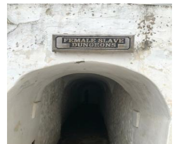
Kacho pou esklav fanm yo

Mwen t ap imajine yo nan ti kacho fè nwa tou long sa yo, kote limyè solèy la pase selman na kek ti tou nan miray la, gason ak fanm pil sou pil, make tankou bèt ak fè cho, swaf dlo af touye yo. Mwen t ap imajine jan prizonye yo do konn kouche atè a sou wòch yo, nan labou santi a pou yo te kapab fè yon ti dòmi. Mwen pa te mem kapab pase nan ti tinèl la ki mennen nan chanm ki pemèt ou rive nan « La porte du non-