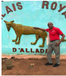
Aldy nan palè Alladah

Anpil nan nou te panse se te nan yon chato wayal, menm jan ak Citadelle Laferrière yo t ap resevwa nou. Men malerezman! Wa yo te pèdi pouvwa politik ak ekonomik yo depi 1894, apre kolon franse yo te vin tabli koloni yo nan Benen. Sel pouvwa dinasti a te genyen alèkile se pouvwa, lide espirityel e pouvwa sa te bout nan limit palè wayal la, wa te sèlman genyen pouvwa sou moun ki rekonèt tèt yo kòm desandan liy wayal yo. Politisyen yo konn itilize yo pafwa tankou gadò mouton pou eleksyon, oswa medyatè pou kèk kriz nan sosyete a.