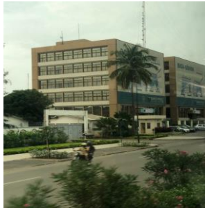
Batiman modèn nan katye coutounou

Nan ayewopò entènasyonal Cotonou, "Cadjehoun Airport", sal kote yo remèt vwayajè zafè yo, te