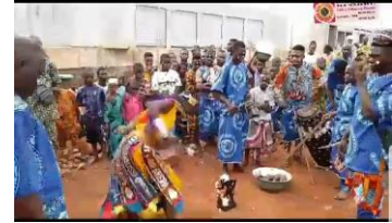
Seremoni vodou nan Benen

Kisa vodou ye pou "Danxomènou" yo? Se yon fòm espiritualite, yon espas kote tout moun egal ego, yon konpreyansyon sou linivè, yon kilti ak yon vizyon mond lan. Pratik sosyal sa a melanje abitud ak koutim pèp Aja-fon ak Yoruba nan Benen. Tout eritaj ak enèji sila ki te andòmi anndan kolèg mwen an te reveye e konekte li ak zansèt li yo nan palè wayal Danxomè.