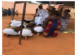
Wa ak sijèli yo