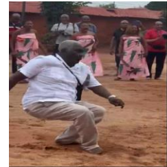
Siméus pran lwa

mitan anfi teyat la, li vire kou toupri, li kilbite, manke tonbe, li kanpe, vire tou won, pedi ekilib, epi l tonbe atè sou do. Koleg mwen an “vann zouti l men l pa bliye metye l”