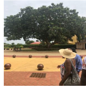
Arbre de l'oubli

Se Ouidah tou nou jwenn "Forè Sakre" ak kèk lòt dye ak pas yo te konn yo kote yo te konn vann esklav yo bay moun ki genyen plis lajan yo, avan yo pran « la route de l'esclavage » pou rive nan « Porte du non-retour ». Te genyen yon seremoni senbolik yo te konn fè esklav yo fè nan lantouray yon pye bwa, anvan yo te anchennen yo e fòse yo ale nan amerik la. Seremoni sila, ki pote non « l'arbre de l'oubli » pou yo te kapab bliye tè kote yo soti a, tè kote yo fèt la, kilti yo, vi yo te genyen an, libète yo ak fanmi yo. Nan seremoni sila gason yo fè nèf tou epi fanm yo fè sèt tou pye bwa, nou menm nou te deside te fè menm jès sila nan lide pou nan esklav yo retounen nan tè kote yo sòti a.