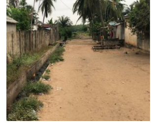
Yon wout nan tè nan lavil Togo

Pandan tan sa, mwen mande yon doktè nan delegasyon an, ki se moun Aken, ak ki wout nan Aken li wè wout sa ki pa asfalte pèpandikilè ak gran wout la sanble. – Li reponn mwen « Wout sa sanble tèt koupe ak ri Pò Sen Lwi ! » Pou nou ka klè sou sa, mwen voye yon foto wout la montre on zanmi m nan Aken zanmi m 'nan Aken. – “Wout Pòs Gay” – Wout ki pase dèyè fò a” - “wout...”.