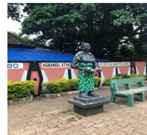
Gwo tanp piton yo

Pandan nou nan wout ap tounen, chofè bis nou an pèdi li pase nan move wout la, yon wout tè nan mitan yon jaden mayi. Mwen te panse mwen te pèdi nan youn nan wout Léogâne nan peyi m yo, nan mitan yon jaden kann. M pa bezwen di w! Mwen te tèlman fatige, nan demen maten dòmni twonpe m bis la te ale kite m. Nou t ap ale vizite Ouidah pou komemore zansèt nou yo. Mwen te anvi vizite Savi anpil. Savi se te yon ansyen pèp Xwéla ki sèvi koulèv Piton, nan "Gwo tanp piton yo".